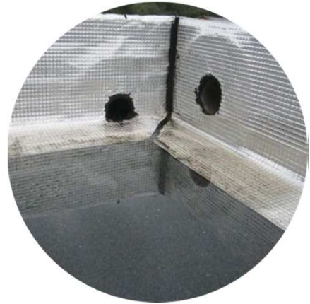
Évacuations mal positionnées