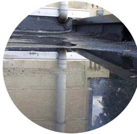
Mauvaises pentes Défauts de planéité