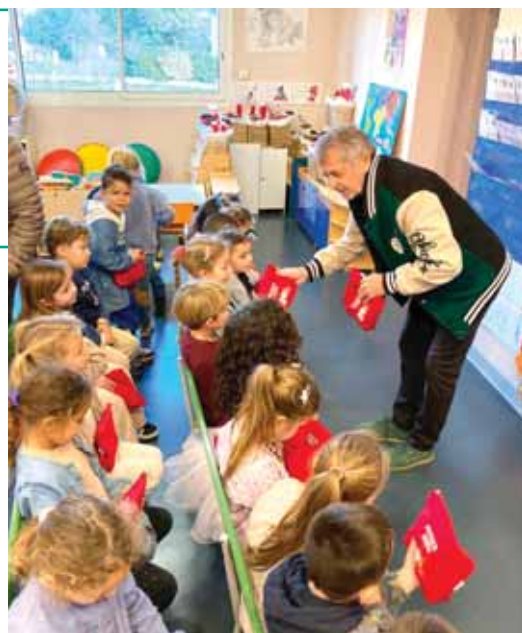
Distribution des cadeaux de Noël en maternelle