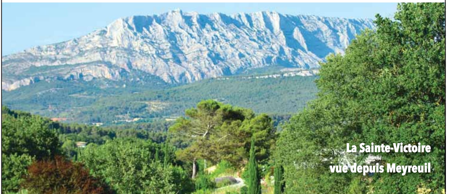
La Sainte-Victoire vue depuis Meyreuil