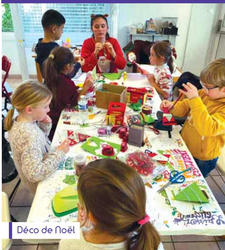
Déco de Noël