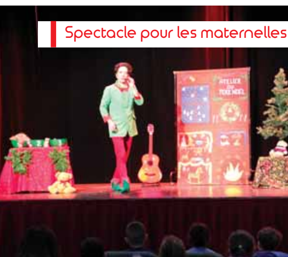
Spectacle pour les maternelles