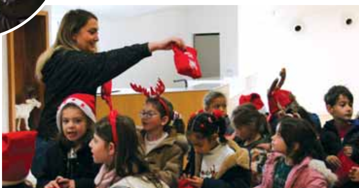
Distribution des cadeaux de Noël aux élémentaires