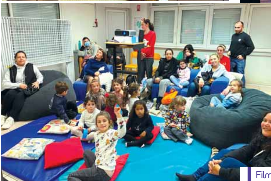
Film de Noël