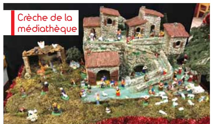
Crèche de la médiathèque

De décembre à fin janvier, les Meyreuillais ont pu admirer le petit monde des santons qui les peuplent.