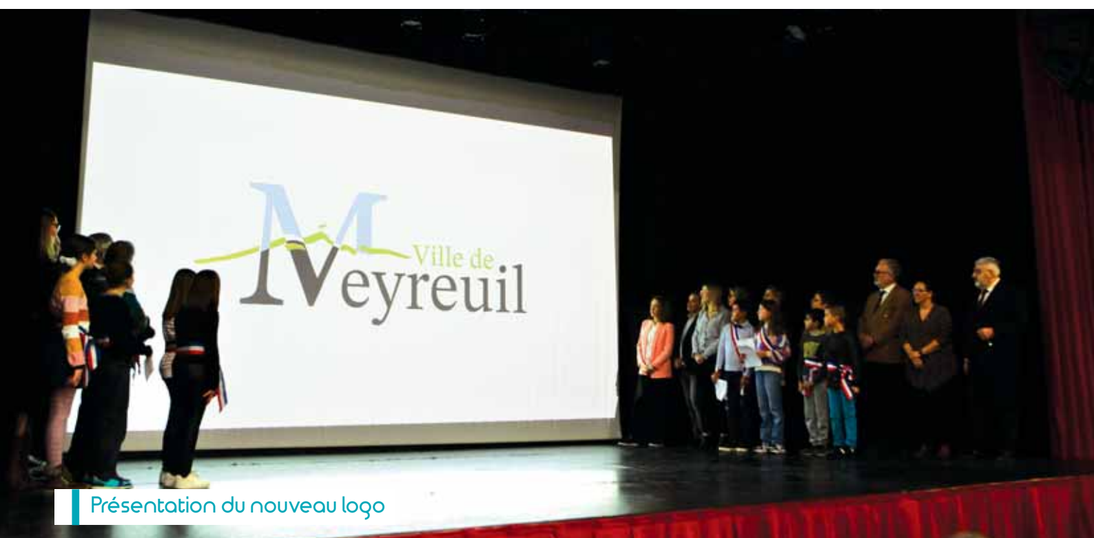
Présentation du nouveau logo