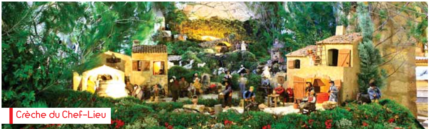
Crèche du Chef-Lieu

La crèche provençale met en scène des personnages traditionnels de Provence, les santons "les petits saints". On y retrouve Jésus, Marie, Joseph, l'âne et le bœuf. Ce sont les santons essentiels vers lesquels convergent tous les autres : les bergers, l'aveugle et son fils, les boumians, le vieux et la vieille, le ravi, et différents personnages représentant des métiers provençaux d'antan.