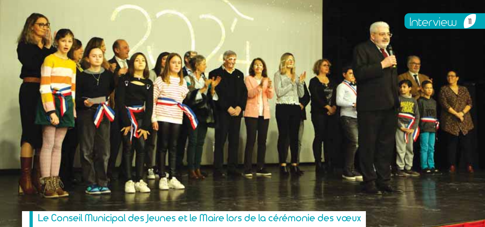
Le Conseil Municipal des Jeunes et le Maire lors de la cérémonie des vœux