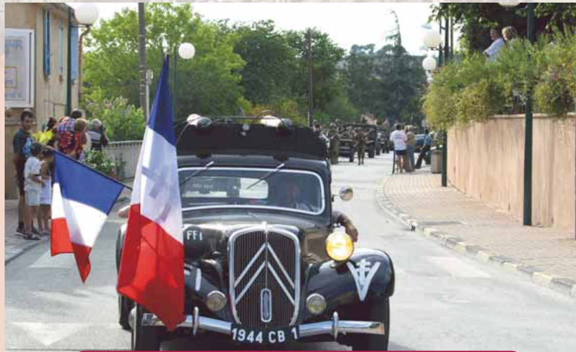
Manifestation tous publics

Venez danser sur les rythmes des années 40' et habiliez-vous d'époque . Hommes, femmes et enfants danseront sur les rythmes de la Libération !