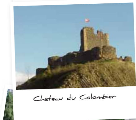
Château du Colombier