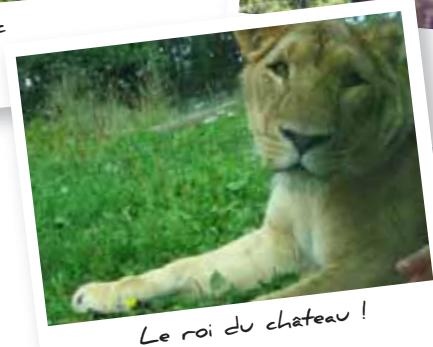
Le roi du château !

Inscriptions du 15 mars au 27 mai 2011 • Séjour limité à 30 enfants