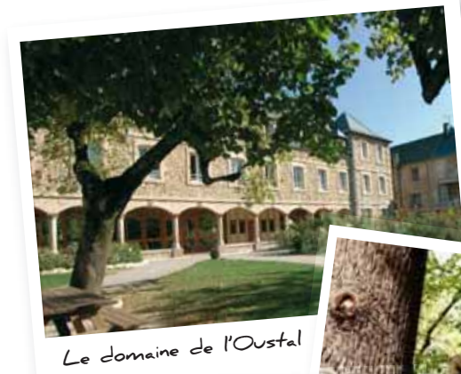
Le domaine de l'Oustal

Hôtel de Ville- Service de la Jeunesse et des Sports 04 42 65 90 50 - l.rubio@ville-meyreuil.fr