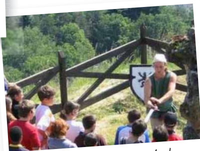
Le moyen-âge revisité !