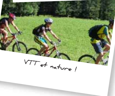
VTT et nature !