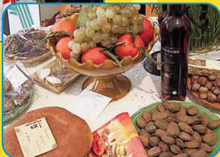
Noël & traditions